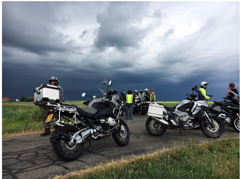
Zwarte lichten - geen druppel regen

Een heel ander Friesland, bosrijk (de Friesche Walden), mooie stuurweggetjes langs de Fries/Drentse grens. Heel even werd Drenthe aangedaan met Oude Willem, Vledder en Wilhelmina-oord.