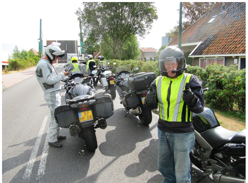
Alternatieve benaming - de open bruggen tocht